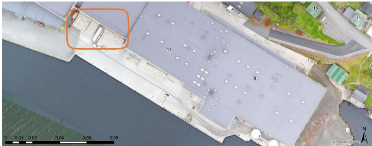
Mynd 2. Markering vísir ætlaða staðseting av lýsitangum.

Sambært viðmerkingunum í skrifinum metir viðkomandi, at kemikaliigoymsla, oljutangi, skorsteinur, dampkókarar og dieselmotorar ikki skulu leggjast kloss upp at bústaðarøki, við stórum árinum og ampa fyrri nærmastu grannar og fólkið í nærumhvørvinum. Viðmerkt verður eisini, at um ein ólukka hendir við nøkrum av hesum, verða nátturan og umhvørvið ávirkað munandi orsakað av plasingini. Hildið verður, at Varðin Pelagic hevur eina skerpaða ábyrgd fyrri trygdini fyrri umhvørvi og fólk, tí at ein vanlukka longu hevur verið á virkinum, har tað tíbetur var ættin henda dagin og eitt hart arbeiðandi slökkilið á landi og sjógvi, ið gjørdi, at nærmasta grannalag ikki brendi í grund og fólk lótu lív.