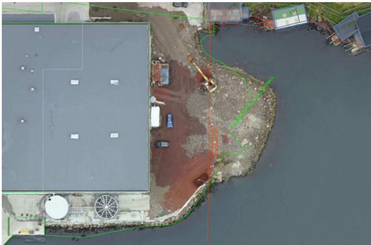
Mynd 1. Verandi útfylling eystanfyrir virkið hjá Varðanum Pelagic og byggisamtyktarmark.

Varðin Pelagic upplýsti eisini, at onkur hevur lagt tilfar út á økið síðan 2022, og at okkurt av hesum kanska er farið í útfyllingina. Varðin Pelagic gjørdi vart við trupulleikan í apríl 2023 og er samskiptið við Tvøroyrar kommunu um hetta sent Umhvørvisstovuni.