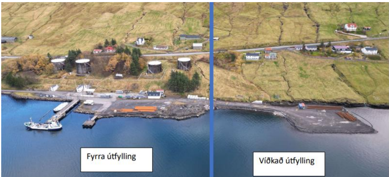
Mynd 2 Fyrra og víðkaða útfyllingin Niðri við Sand í Søldarfirði

Í umsókn frá Runavíkar kommunu dagfest 31. august 2023 verður víst til umhvørvisgóðkenning av verandi útfylling í norðara enda av havnarlagnum Niðri við Sand, ið var latin Runavíkar kommunu 21. januar 2022. Greitt verður frá, at síðani útfyllingin í norðara enda er liðugtgjørð, eru broytingar gjørðar í ætlanunum fyri virksemi á havnarlagnum Niðri við Sand. Umframt oljugoymslu til Effo og Magn, er ætlanin eisini at gera eina bryggju, ið klárar at taka ímóti størri tangaskipum. Sambært Runavíkar kommunu verður samlaða víddin av havnarlagnum Niðri við Sand 15.000 m 2 stórt, tá arbeiðið er liðugt (sí mynd 2). Støddin á víðkaðu útfyllingini í sunnara enda av havnarlagnum Niðri við Sand verður umleið 7.400 m 2 , tá hon er liðugtgjørð.