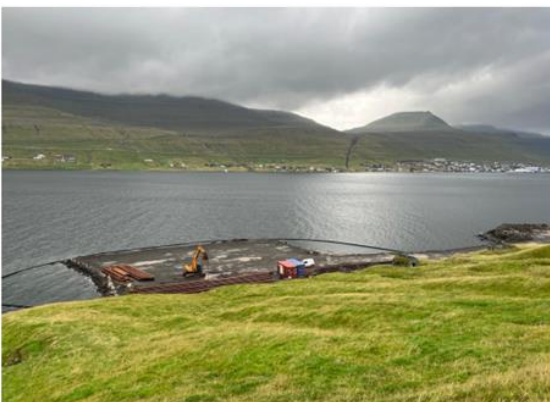
Tekning 1 og mynd 1 av status á havnaútbygging dagfest 8. september 2023