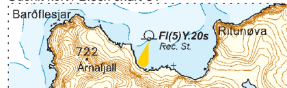
Søkortrettelser / Chart Corrections 36/485 2019