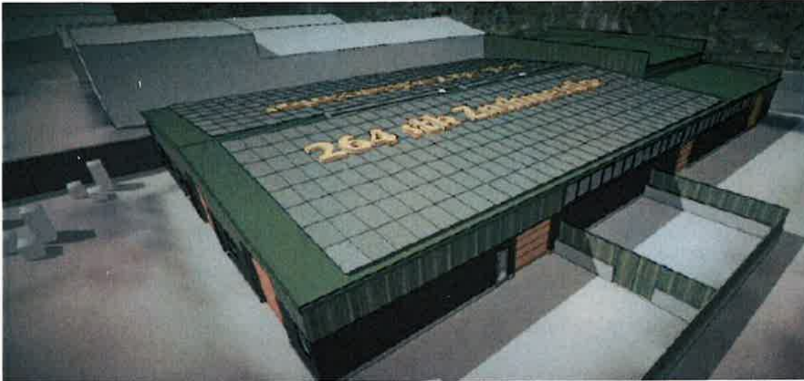
Mynd 1. Sólkyknur á takinum á landstøðini í Miðvági