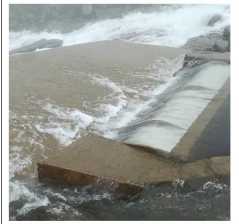
Inntak hjá Zarepta í áarføri (tá “í mesta lagi” fer ígjøgnum).