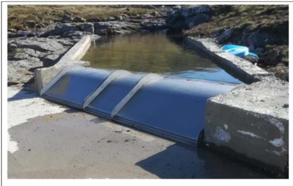
Inntak hjá Zarepta í góðveðri.