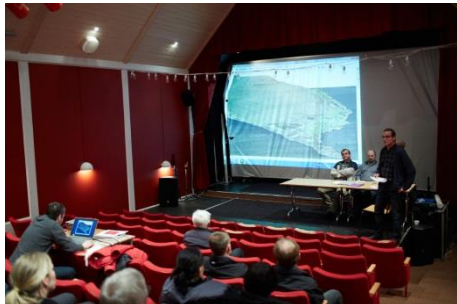
Góðskumetingarkort varð víst á stórskýggja,

Fitt av práti var um góðskumetingina og týðningin av henni. M.a. varð settur spurningur við, um metingin av jørðini er tíðarhóskandi og samsvarar við dagsins brúk og virði. Útskiptingarlógávan og praksis á økinum eru tó ikki at fara skeivur av, tað er jarðarbrúkið og harvið jørðin sum búnaðarjørð, sum er skiftisgrundarlagið.