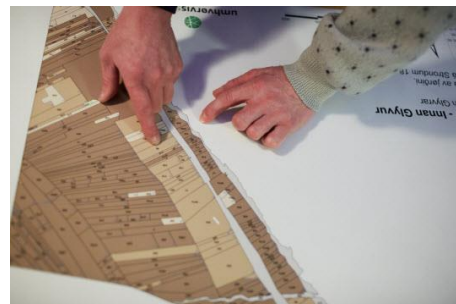
og nærlisin á borðinum

Møgulig kæra skal sendast Yvirútskiptingarnevndini við Sorinskriveranum, C. Pløysngøta 1, postboks 28, 110 Tórshavn. Hetta verður kunngjørt, og kærufreistin, sum er 3 mánaðir, verður ásett.